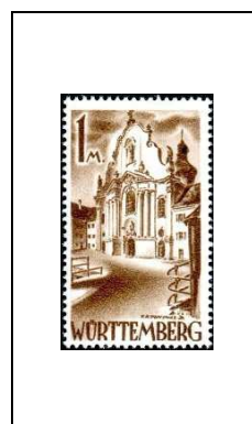
Monastère de Zwiefalten