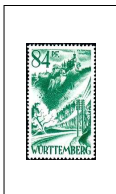
Château de Liechtenstein