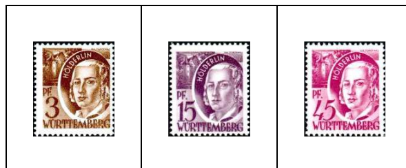
Holderlin et tour Holderlin, à Tübingen