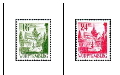
Couvent de Bebenhausen