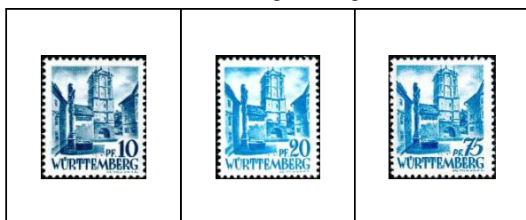
Porte de Wangen (Aligau)